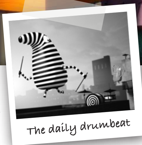
The daily drumbeat