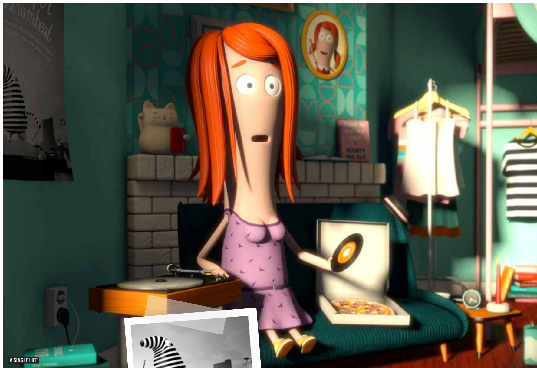
A SINGLE LIFE