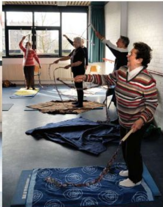
DIENSDAG 13.15 UUR • POST WEST-TIDEMANSTRAAT 80 • HET NIEUWE WESTEN