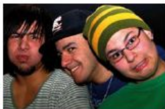
In de wijk