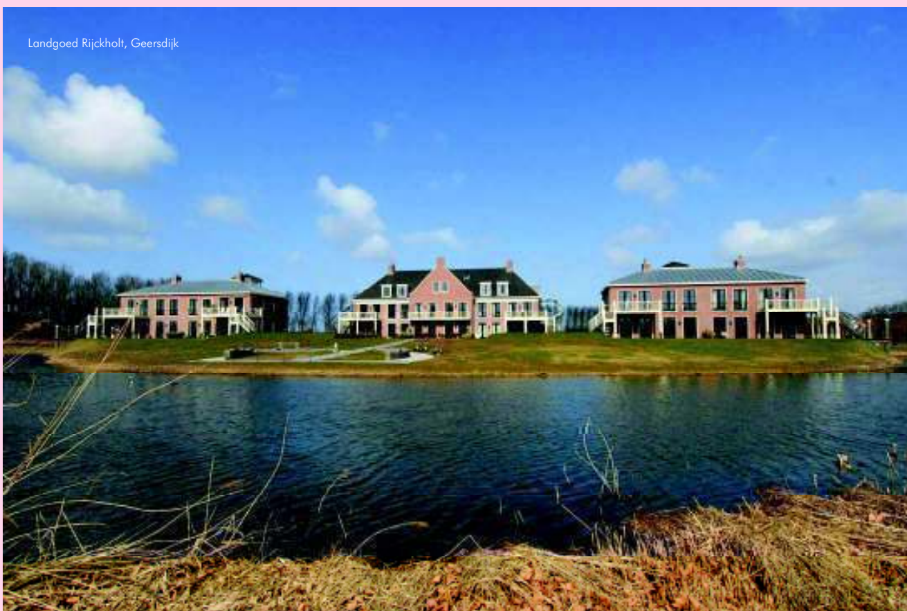
Landgoed Rijckholt, Geersdijk