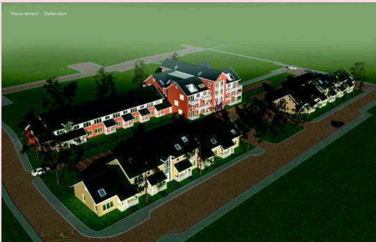
'Mavo-terrein' - Stellendam

Minder blij met: Vertraging uitvoering van de plannen voor de Gronden van Breen in Ouddorp