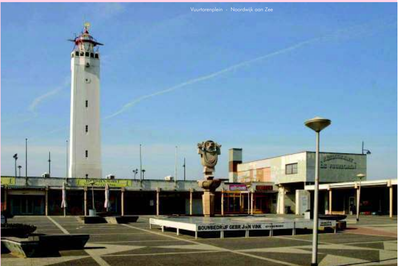
Vuurtorenplein - Noordwijk aan Zee

teamleider Ruimtelijke Ontwikkeling, Stedenbouw, ruimtelijke beeldkwaliteit, landschap, natuur en milieu.