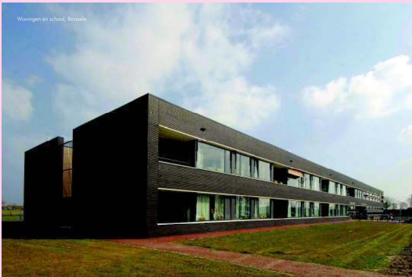
Woningen en school, Borsele

Minder blij met: het advies over de aanbouw van een woning in het buitengebied, dat niet goed uitpakte