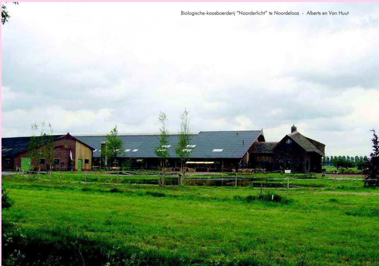
Biologische-kaasboerderij "Noorderlicht" te Noordeloos - Alberts en Van Huut

Minder blij met: Oprukkende verstedelijking