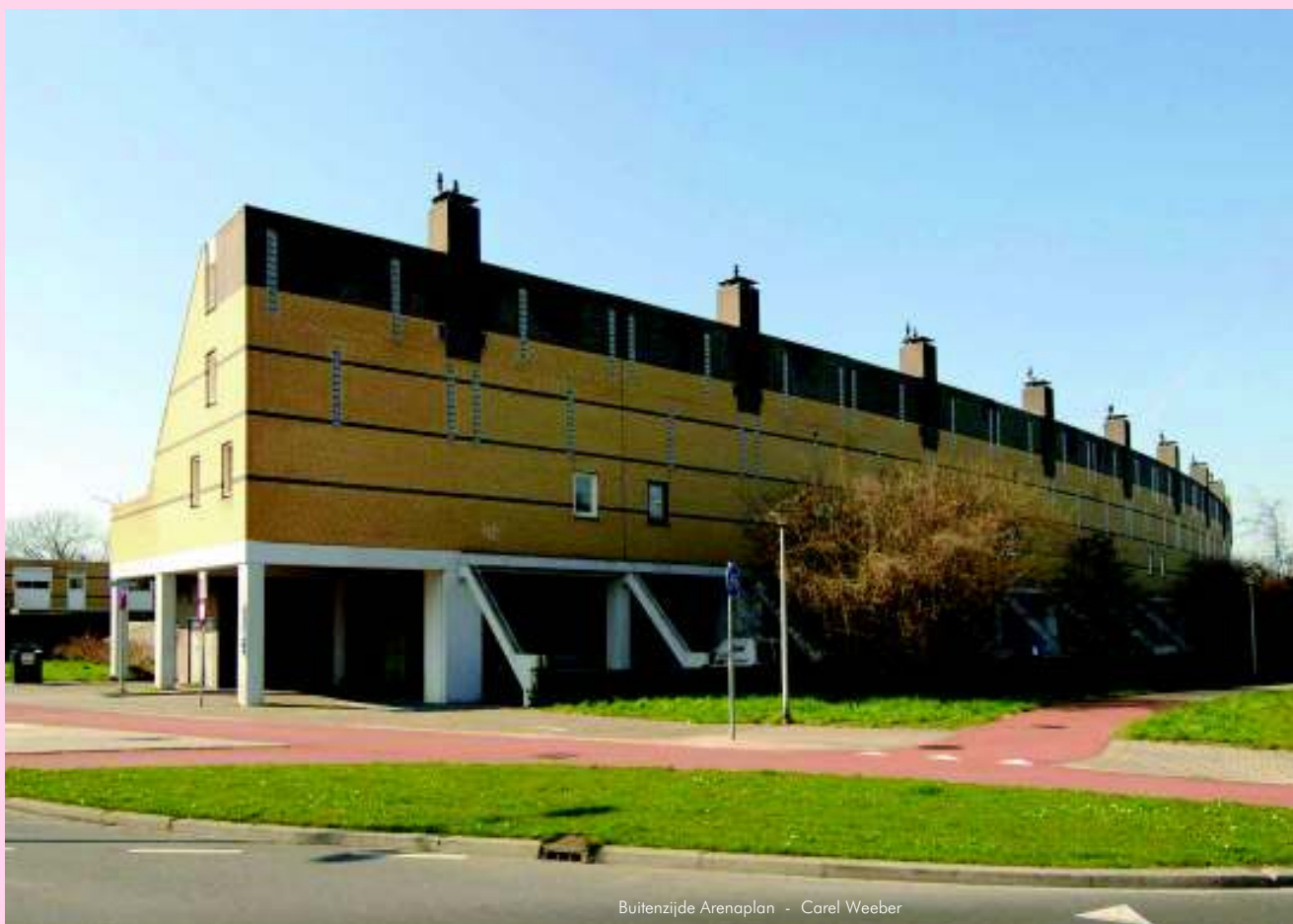
Buitenzijde Arenaplan - Carel Weeber