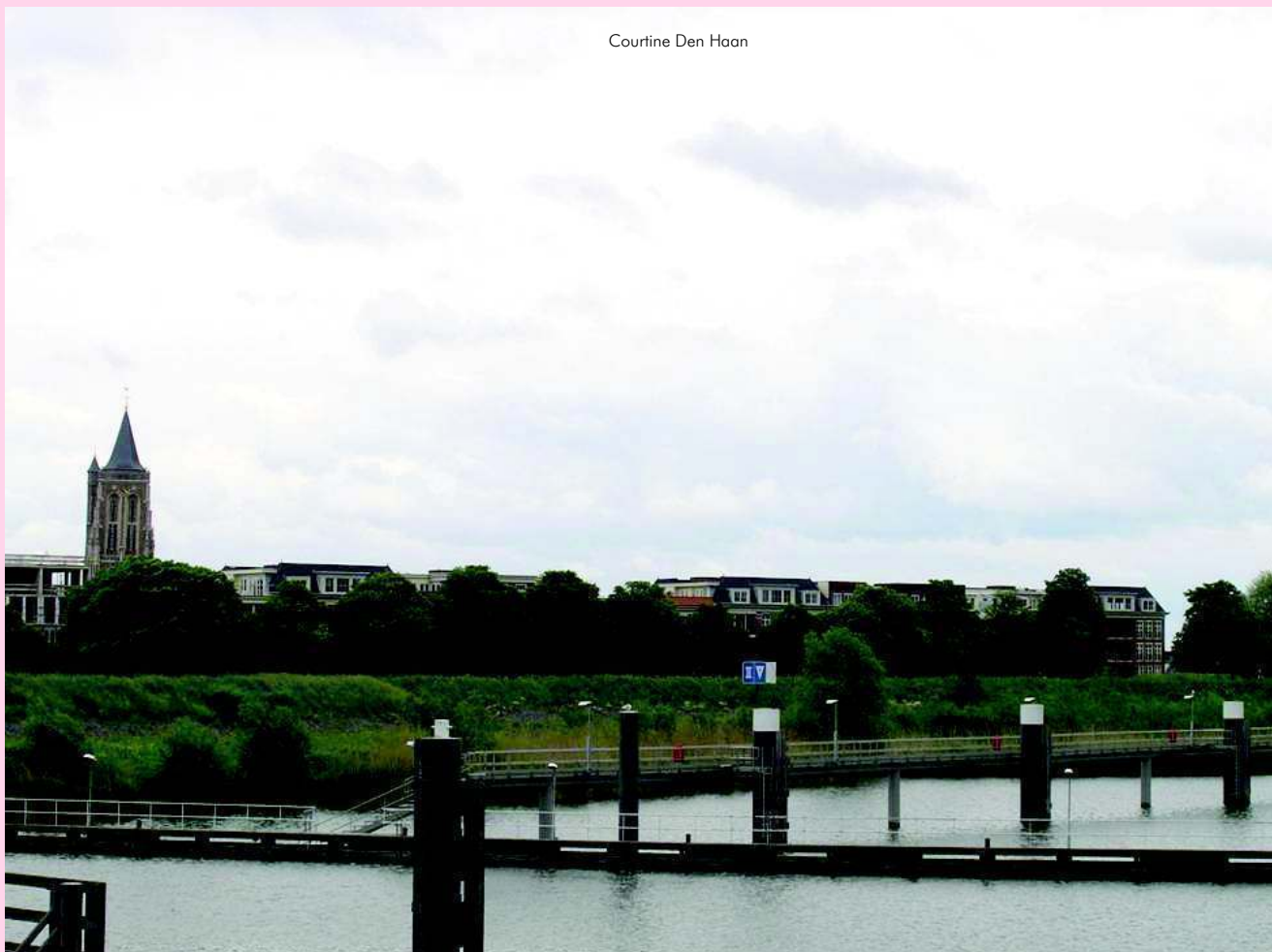
Courfine Den Haan

Minder blij met: Enkele 'pukkels' in het centrum