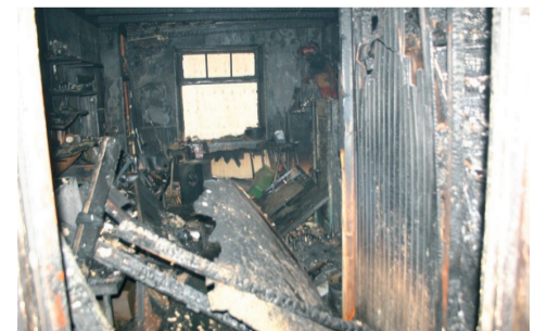
Een pannetje op het vuur...

Lees op pagina 2 alles over rookmelders.