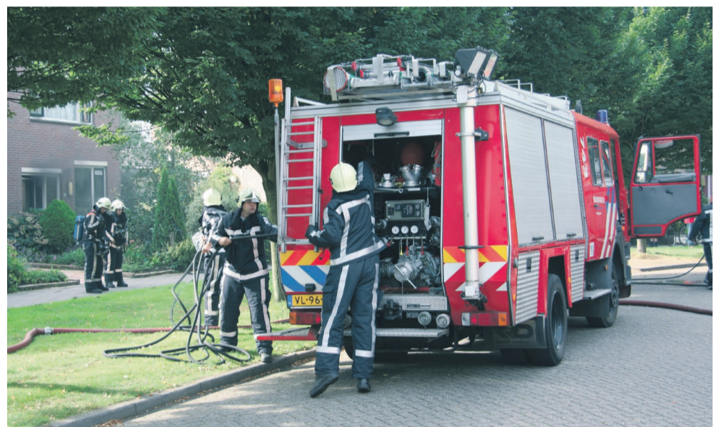
U hebt een paar minuten om uzelf in veiligheid te brengen.

Doe de brandveiligheidscheck op pagina 3.