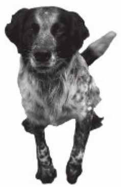
Naam: Redie Ras: Valleyholländer Leeftijd: 3 jaar Ouders: onbekend, uit kruist Geslacht: geen Uiterlijk: korre en sterke post, schone lijn en kop met wit oor.

Conclusie Na deze vijf weken bij honden in Rotterdam, de horeca is best wel honden vriendelijk en er zijn veel hondenvriendelijke horeca's. Gasten die met hun honden in een horeca willen zitten, zijn niet altijd bij met een hondenvriendelijke horeca. De meeste horeca's zijn honden vriendelijk.